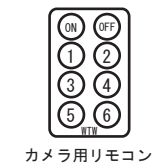
カメラ用リモコン