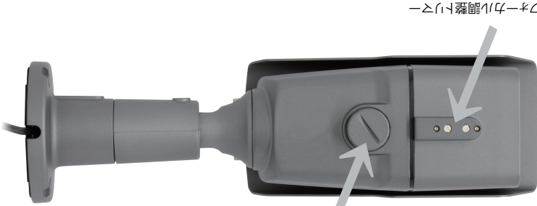
バッテリー・ケーブル調整トリアー

本機底面に、調整トリアーがついておきますので、 マニュアルボタンなどで調整を行ってください。